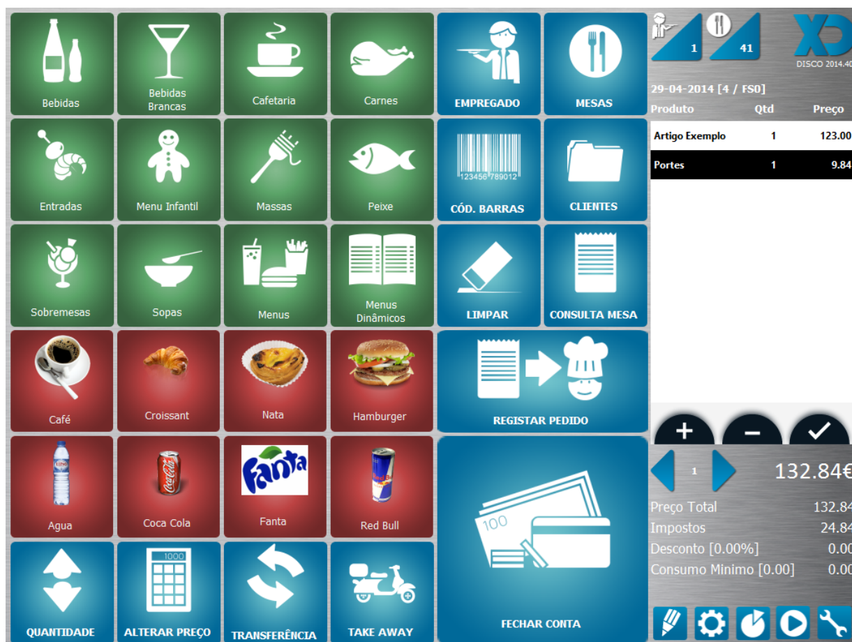
Figura 2 – Adicionar Portes ao documento

Sendo os portes um artigo o seu lançamento para o documento é feito da mesma forma que qualquer outro artigo. Após o lançamento dos artigos que se pretendem para o documento, poderá adicionar o artigo do tipo “Portes”. Os portes serão visíveis na grelha de lançamento lateral e poderão ser adicionados ou removidos outros portes.